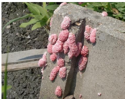
用水路（水口）の卵塊