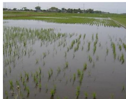
食害を受けた水田