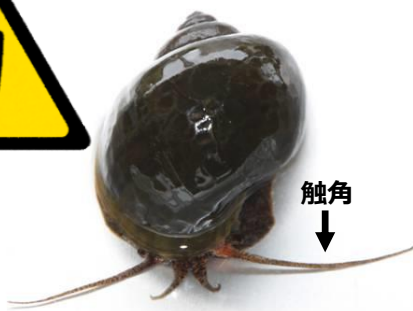
ジャンボタニシ (スクミリングガイ)